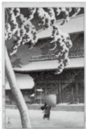
川瀬巴水「芝罘上寺」大田区立郷土博物館蔵