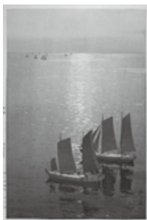
吉田博「光る海」個人蔵