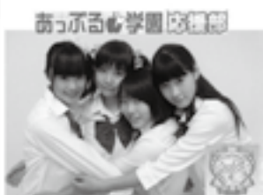
アップル学園応援部