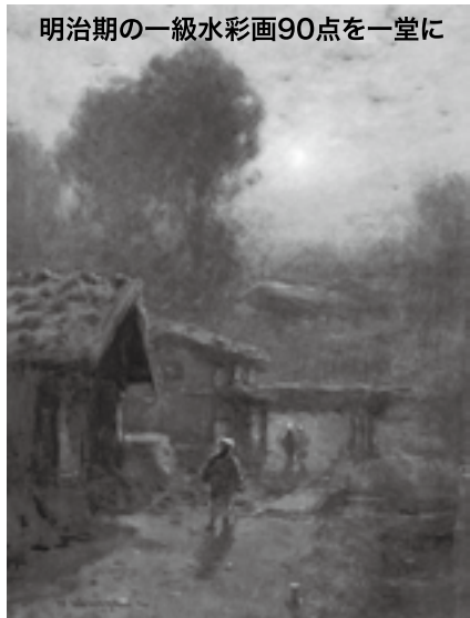
「おぼろ月夜」中川八郎(郡山市立美術館蔵)