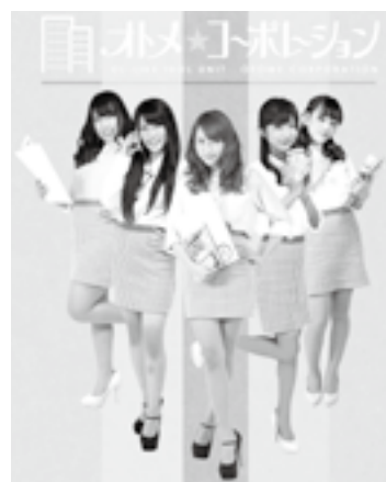
オトメ☆コーポレーション