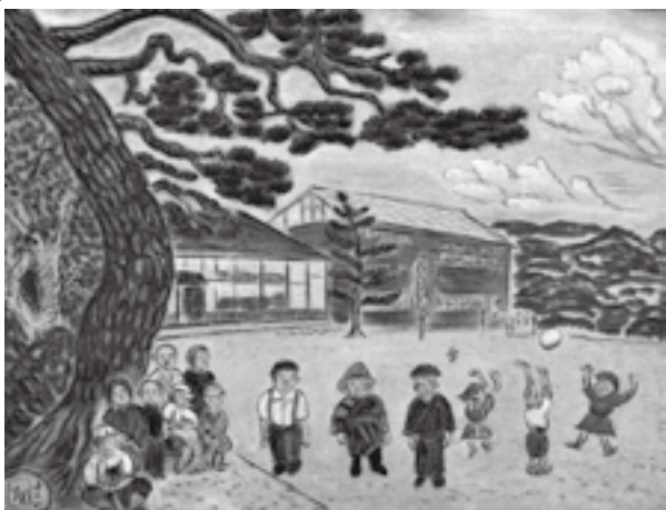
水内小学校校庭(信州新町美術館蔵)

■〒389-0515 東御市常田505-1 ■TEL 0268-62-3700 FAX 0268-62-3262 ■開館時間 9時から17時 ■入館料 200円(高校生以上)