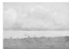
三毛虎己(みけにっく)「大津」