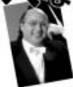
ラファエル・ゲーラ(ピアノ)