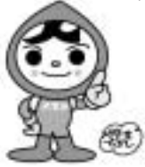
人権イメージキャラクター 人KENまるる君

12月10日の「世界人権デー」（世界人権宣言が採択された日）にあわせて、12月4日（火）～10日（月）を「第64回人権週間」とし、人権意識の高揚を図ってまいります。