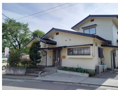
第2おひさまこども園