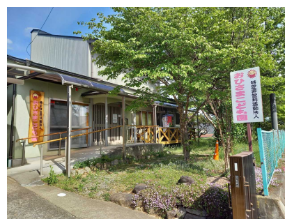
第3おひさまこども園