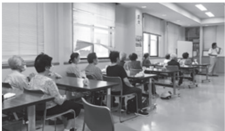
田中「おいでよカフェ」の様子

田中「おいでよカフェ」の様子 田中「おいでよカフェ」の様子 田中「おいでよカフェ」の様子