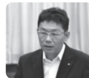
窪田 俊介 議員

田中「おいでよカフェ」の様子 田中「おいでよカフェ」の様子 田中「おいでよカフェ」の様子