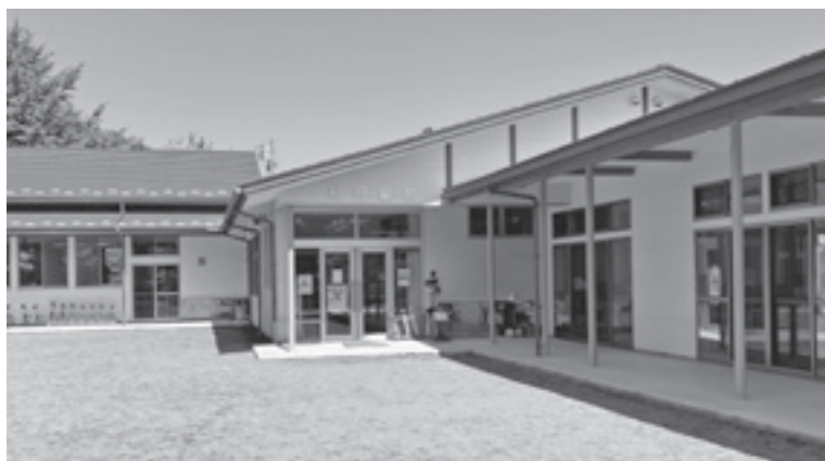
児童館／児童クラブ（和）

問 学校休業日の児童クラブと児童館の利用状況は。児童クラブの定員は40人前後。春休み中の利用者数は一日平均20～40人程度。児童館の定員は定めていないが、一部の施設で小学3年生迄としている。春休み中の利用者数は10～20人程度であった。 答 児童クラブおよび児童館の利用申し込みに対し断っているケースはある。児童館では断るケースはなかった。 問 児童クラブが利用できず、児童館も開館時間が9時であり、出勤時間調整に苦心している。児童にとつての負担が大いなのではと考える。 答 ファミリーサポート制度についてどう考えるか。 問 ファミリーサポート制度についてどう考えるか。 答 児童クラブ・児童館問題のほかに地球温暖化対策についての質問も行った。