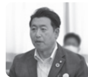
田中 博文 議員

問 空き家の活用について取り組みはどうか 答 地域住民を対象に空き家セミナーを行っている