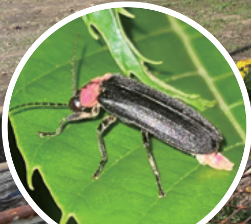
「大川ホタルの里」のホタル