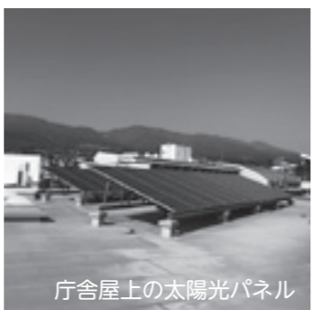
庁舎屋上の太陽光パネル

議会としても、しっかりした精査と計画づくりをお願いするとともに、住民への説明もお願いしつつ見守っていきたいと考えています。