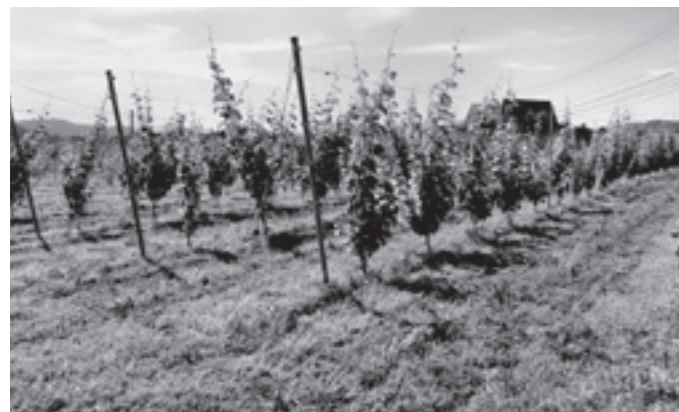
きれいに植えられたワインブドウ畑

きれいに植えられたワインブドウ畑 5分の3が国から交付される、差額は市の一般財源となる。