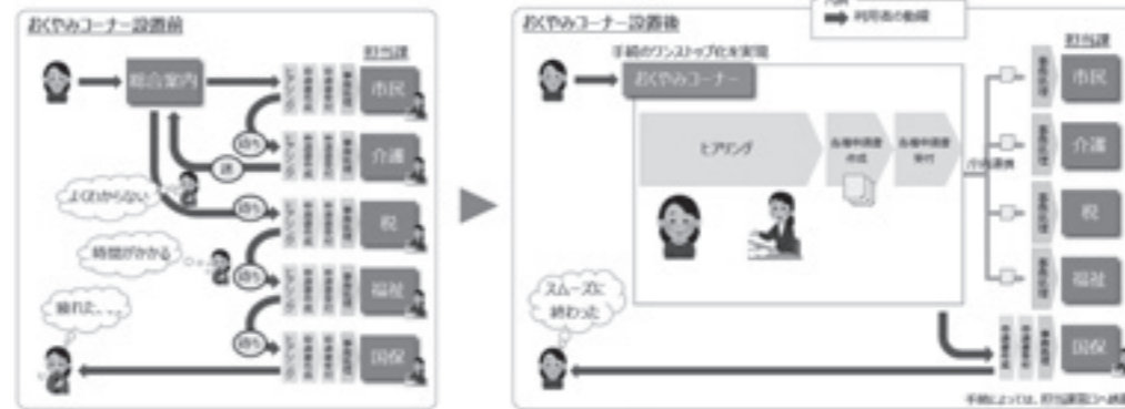
「お悔やみコーナー」のイメージ図

問 ワンストップでできる 「お悔やみコーナー」の設置は 設置については 今後検討をはじめめる 答 家族や親族が亡くなった後の手続きを、ワンストップでできる「お悔やみコーナー」の設置はどうか。 市民生活部長 手続きは多種多様で、遺族の負担感は大さきと考える。設置については、手続きが多岐にわたることや、市役所本庁舎と総合福祉センターが離れた場所にあることなども含め、今後検討を始める。 市はマイナンバーカードの普及率が75%を超えている。窓口手続きのオンライン化について「行かない」とも、「啓発に努めていく」 自転車用ヘルメット購入に対する補助について 今年4月から自転車用ヘルメット着用が努力義務化されたが、周知はどのようか。また、補助の予定はあるか。 市民生活部長 ヘルメット着用を推進するためにも、補助は1つの策と考える。他の自治体の状況など研究していくとともに、啓発に努めていく。