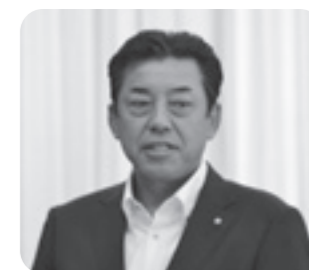
斎藤 哲 議員

市内の小学校で児童8名が犠牲となった事件から、全国の小学校は外部からの侵入を遮断してきたが、近年は地域文化やスポーツ・芸術の継承・指導を目的として人々を受け入れる方向へ転換しているが、市内小学校・保育園の不審者対策の現状を伺う。 教育次長 市内の各小中学校では危機管理マニュアルを基に職員訓練、児童・生徒の安全確保のための避難訓練に取り組んでいる。 公民館などの施設の予約について スポーツ施設のネット予約を開始するが、他の公衆施設のネット予約の計画を伺う。 総務部長 市民の利便性向上に向け、順次導入する準備を進めていく。