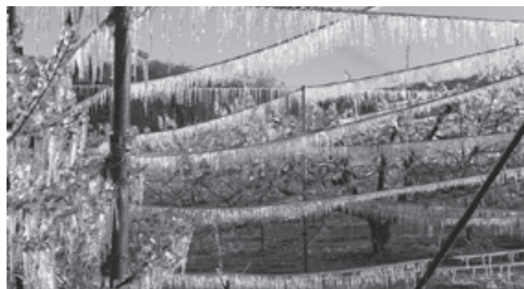
凍霜害対策した、樹園地の朝

凍霜害対策した、樹園地の朝 凍霜害対策した、樹園地の朝 凍霜害対策した、樹園地の朝