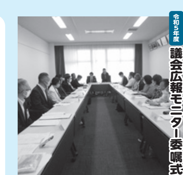
令和5年度 議会広報モニター委嘱式

認知症対策として今後 取り組むべき課題と方向性は 症状が進行する前に早期に 相談につなげる事である