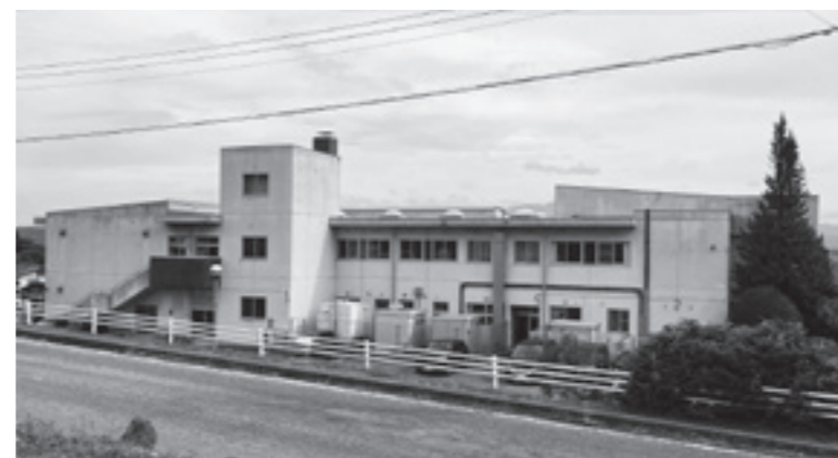
市内の小学校（祇津）

市内の小学校で児童8名が犠牲となった事件から、全国の小学校は外部からの侵入を遮断してきたが、近年は地域文化やスポーツ・芸術の継承・指導を目的として人々を受け入れる方向へ転換しているが、市内小学校・保育園の不審者対策の現状を伺う。 教育次長 市内の各小中学校では危機管理マニュアルを基に職員訓練、児童・生徒の安全確保のための避難訓練に取り組んでいる。 公民館などの施設の予約について スポーツ施設のネット予約を開始するが、他の公衆施設のネット予約の計画を伺う。 総務部長 市民の利便性向上に向け、順次導入する準備を進めていく。