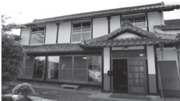
空き家を再利用した民泊（田沢区）

問 学校休業日の児童クラブと児童館の利用状況は。児童クラブの定員は40人前後。春休み中の利用者数は一日平均20～40人程度。児童館の定員は定めていないが、一部の施設で小学3年生迄としている。春休み中の利用者数は10～20人程度であった。 答 児童クラブおよび児童館の利用申し込みに対し断っているケースはある。児童館では断るケースはなかった。 問 児童クラブが利用できず、児童館も開館時間が9時であり、出勤時間調整に苦心している。児童にとつての負担が大いなのではと考える。 答 ファミリーサポート制度についてどう考えるか。 問 ファミリーサポート制度についてどう考えるか。 答 児童クラブ・児童館問題のほかに地球温暖化対策についての質問も行った。