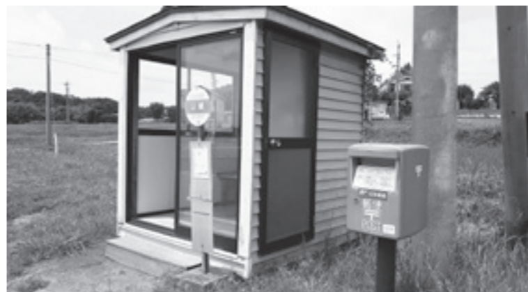
定時定路線バスのバス停

定時定路線バスの 増える利用への対応はどうか 定員が不足する場合は、 規模の大型化など対応をする