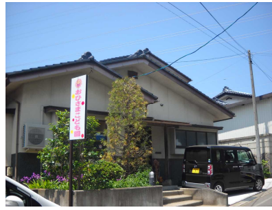
第2 おひさまこども園