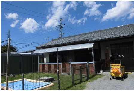
第1 おひさまこども園