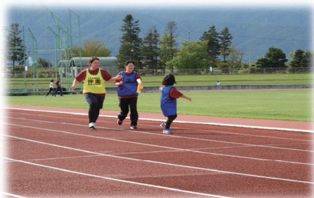
東御市チームでユニバーサルリレーへの参加

また、障がい者に配慮した施設のバリアフリー化に努めることはもとより、心のバリアフリー化、情報のバリアフリー化にも努めます。