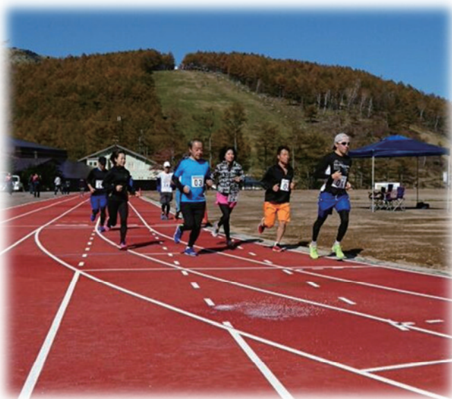
1泊2日でランニングセミナーを開催

起業支援においては、スポーツ医科学・スポーツビジネス研究の専門機関、企業等と連携を図ります。例えば、運動・栄養分野の研究機関と連携した商品開発、スポーツビジネスの研究機関と連携した市場調査・販路開拓等が考えられます。