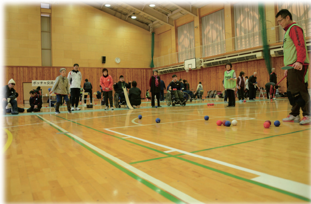
ボッチャ交流大会