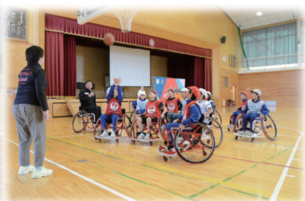
小学生による車いすバスケット体験