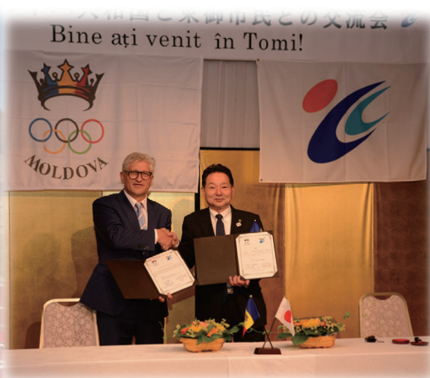
ホストタウン相手国モルドバ共和国と市民交流事業に関する覚書を締結