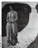
ふれあい館 入場無料

TEL 0268-62-3700 FAX 0268-62-3262 〒389-0515 東御市常田505-1 東御市文化会館内 ■開館時間9:00~17:00 ■会期中無休 ■入場無料