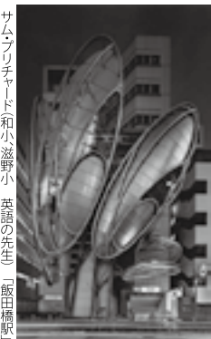
サム・プリチャード 和紙小瀬野小 英語の先生 飯田橋駅