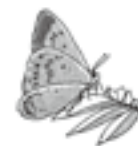
市の蝶 オオルリシジミ