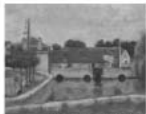
河野 扶「赤い屋根の家」